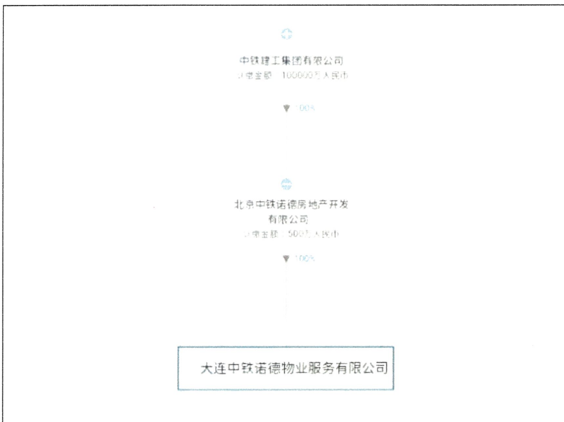
大连中铁诺德物业服务有限公司股权结构图